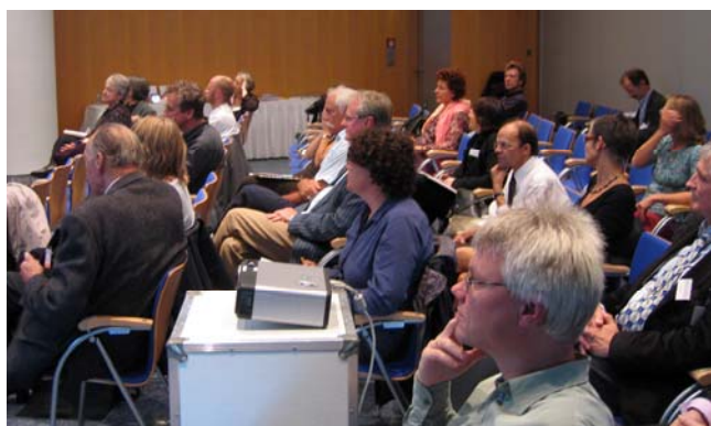
Internationales Publikum bei der DNI-Veranstaltung im Rahmen der DGI-Konferenz

Wie bereits in den Vorjahren hielt das Deutsche Netzwerk der Indexer (DNI) auf der diesjährigen Frankfurter Buchmesse sein Jahrestreffen ab – diesmal im Rahmen der Jahreskonferenz der Deutschen Gesellschaft für Informationswissenschaft und Informationspraxis (DGI). Im Mittelpunkt des Treffens stand eine offene Informationsveranstaltung mit Präsentationen zu Aspekten professioneller Registererstellung, die sehr gut besucht war.